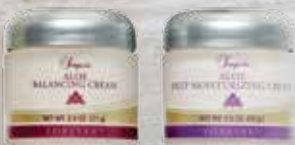
} Aloe Balancing Cream Aloe Deep Moisturizing Cream